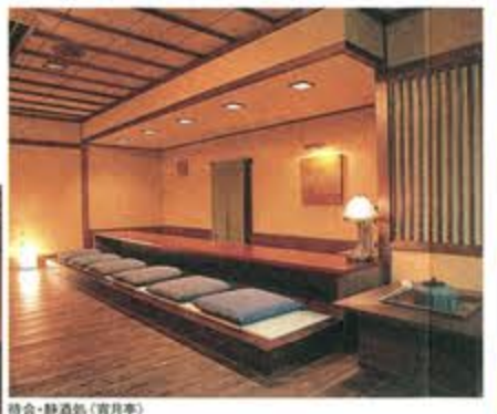
待合・静酒処 (宵月亭)