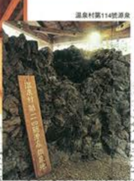
温泉村第114号温泉泉